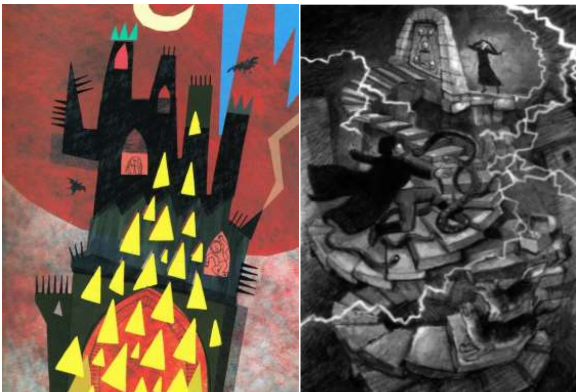
Figg. 5 e 6. Il castello del negromante nell'edizione polacca (a sinistra) e in quella inglese (a destra).