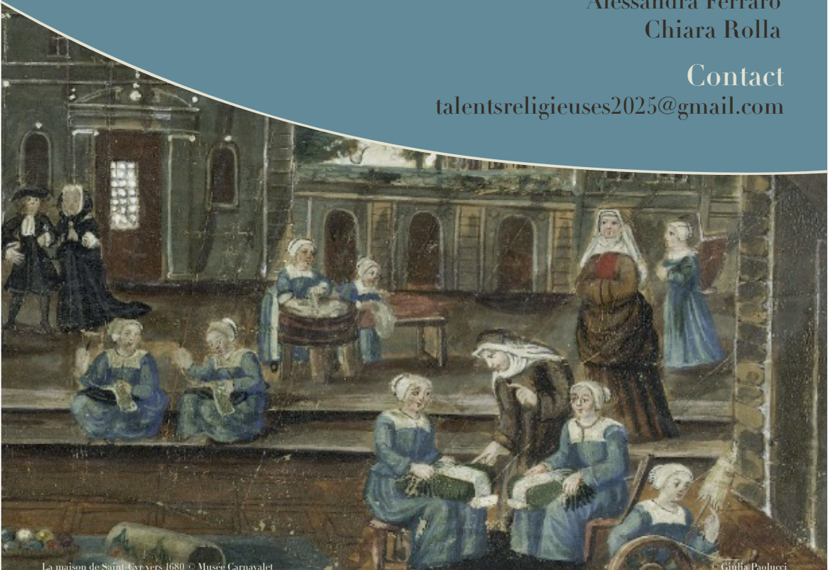
La maison de Saint-Cyr vers 1680